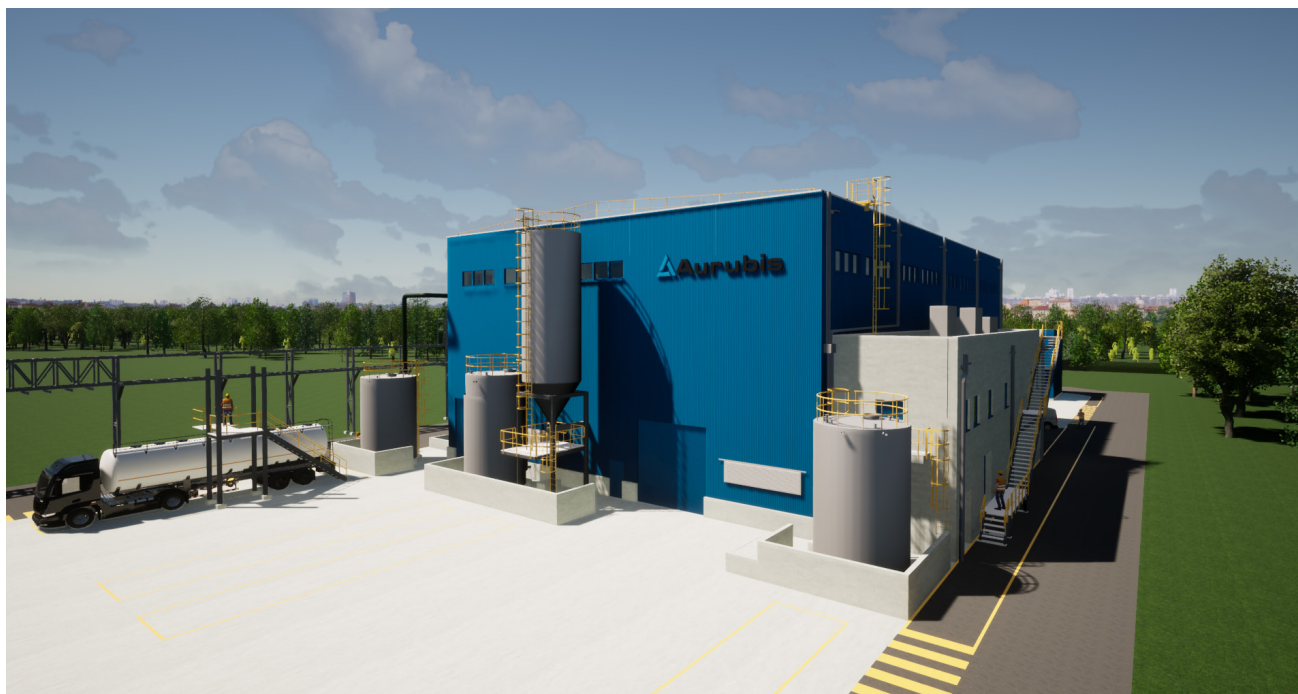
Een animatie van de nieuwe ASPA-installatie in Aurubis Beerse.

Op de site van Aurubis Beerse in België werd de uiterst moderne ASPA-recyclinginstallatie gebouwd. Anodeslib wordt hier verwerkt volgens een nieuw door Aurubis ontwikkeld proces. Daardoor zullen we meer waardevolle metalen uit hetzelfde tussenproduct kunnen halen en dat sneller dan voorheen.